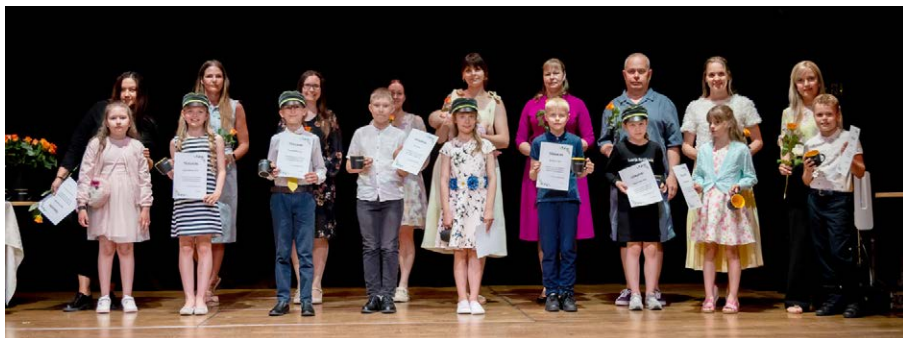
Tunnustatud 2. klasside õpilased