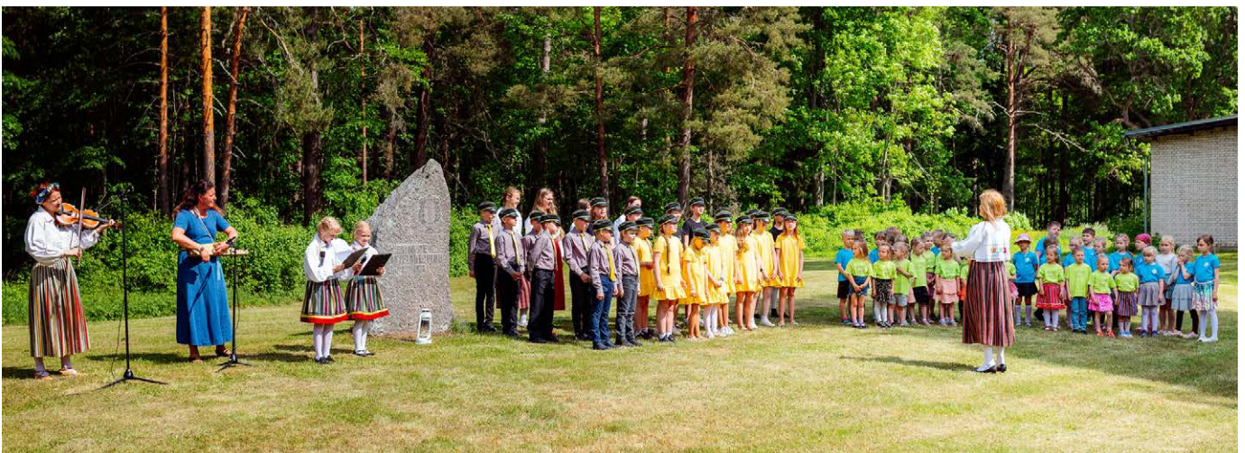
Lastelaulupeole eelnenud päeval toimus Kabinas laulupeo kivi juures tule süütamise tseremoonia, kus esinesid Luunja keskkooli lastekoor ja Luunja lasteaija Midrimaa mudilaskoor.