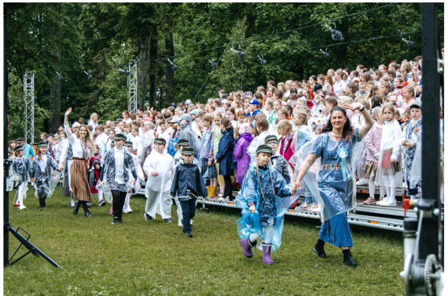
Laulupeole eelnes kooride ja koorijuhide rongkäik läbi Luunja.