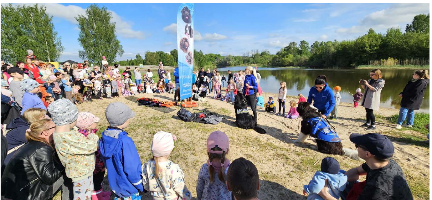
Lõuna-Eesti veepäästekoerte grupi Märjad Käpad demoesinemine Emajõe kaldal.