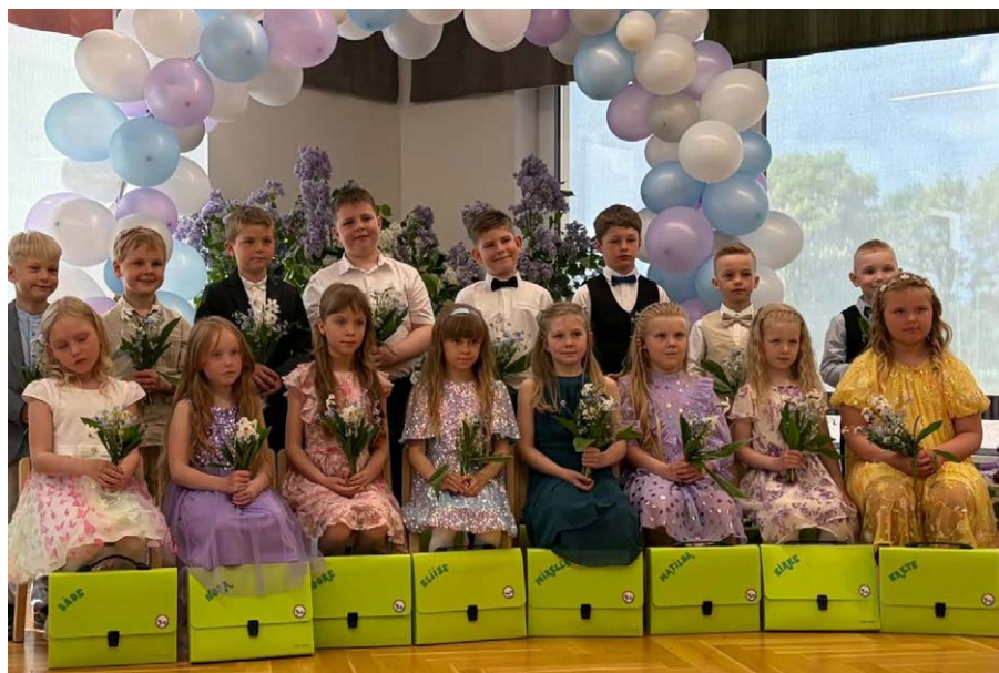
Midrihiirte ja Midrilindude rühma lõpetajad.