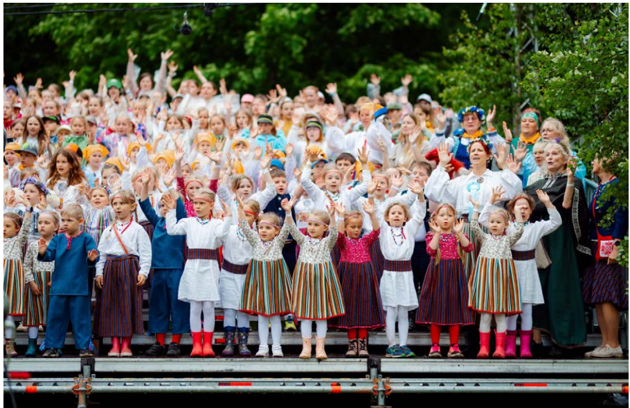
Lastelaulupidu tõestas imelise vaatepildiga, et laulutraditsioon elab ja kasvab koos uue põlvkonnaga.