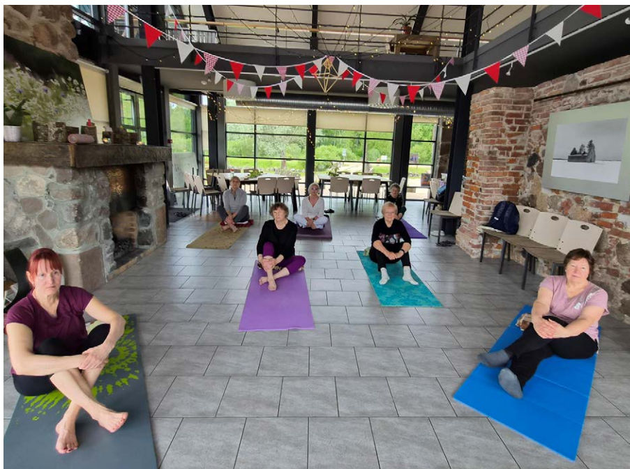
Juba traditsiooniline vaimse tervise päev Emajõe-Suursoo keskus.