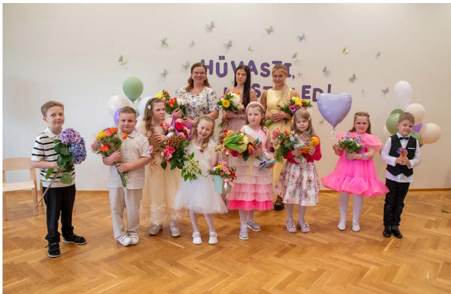
Kuujänesed rühma lõpetajad.