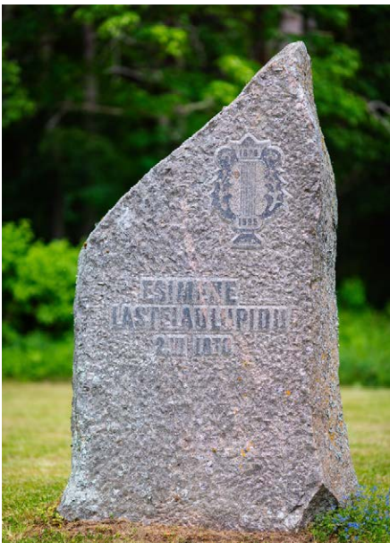
Esimese lastelaulupeo mälestuskivi Kabinas

Luunja kultuuri- ja vabaajakeskuse korraldataval lastelaulupeol osales