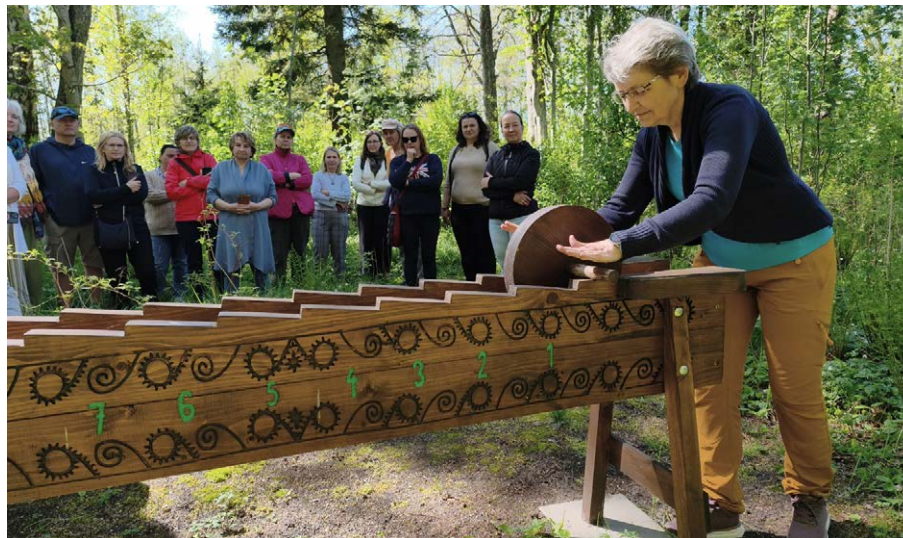
Sille mälutreenerite koordineerimisharjutust sooritamast Hiiuemaal.