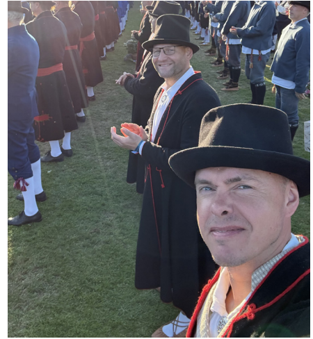
Kolmanda kontserdi finaalis.

Kui keegi oleks mulle aasta tagasi öelnud, et seisan koos tuhandete meestega Rakvere staadionil ja tantsin meeste tantsupeol, oleksin seda üsna ebatõenäoliseks pidanud. Täna meenutan möödunud tänutundega. Küll on tore, et leidub järjekindlaid inimesi, kes esimesest „ei“-st ennast mõjutada ei lase. Ja suurepärase, et leidub inimesi, kes teevad oma tööd pühendumuse ja missioonitundega, tulevad oma vabast ajast ja perede kõrvalt kokku, et traditsioone ja kultuuri edasi kanda.