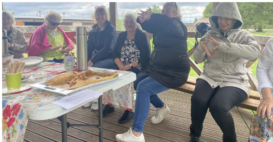
Mäluksõude söömeharjutus.