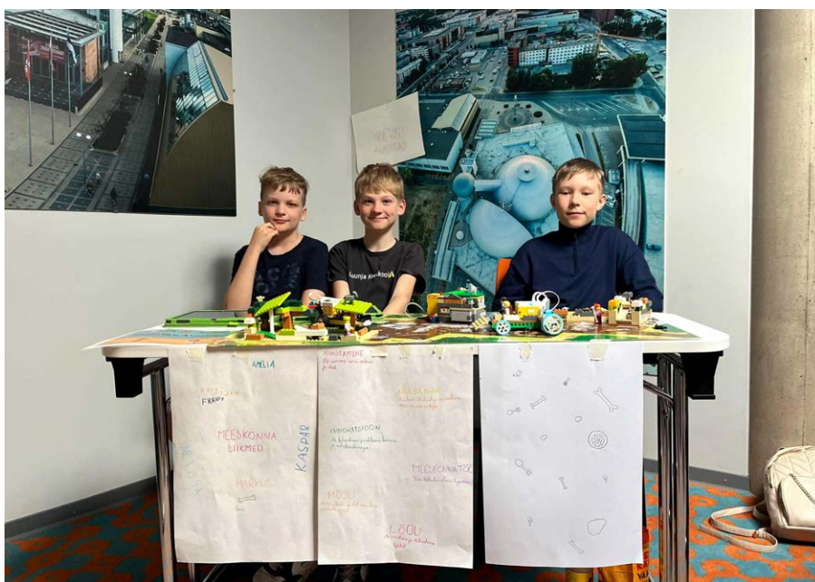
Luunja keskkooli robotika rühm