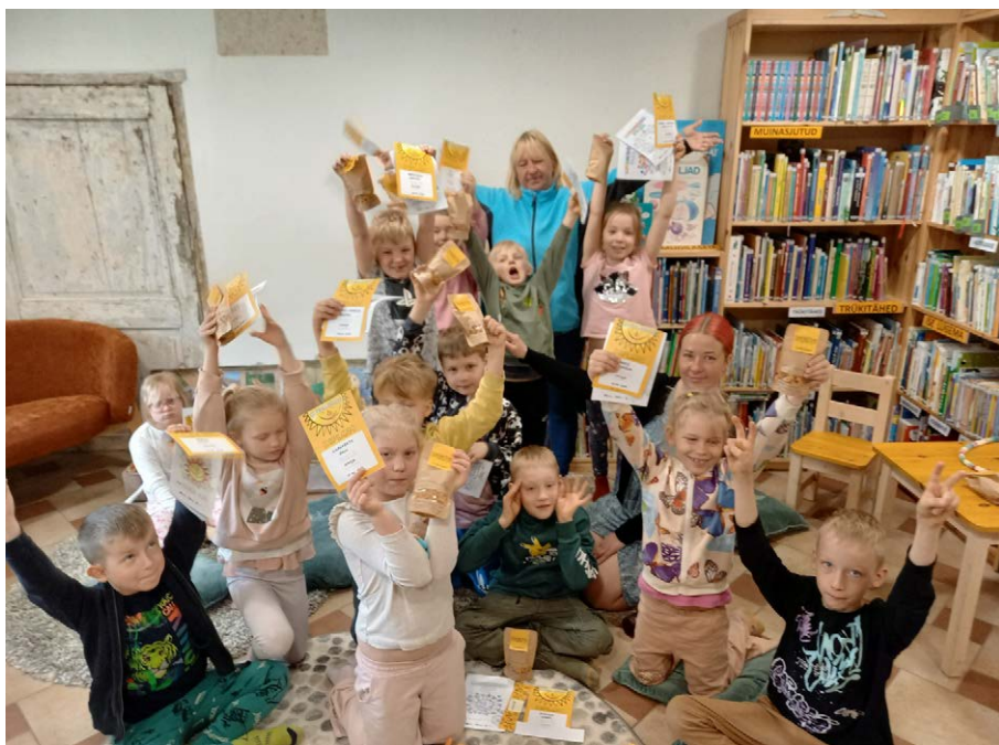
Väikesed midrimõmmid lugemisisu lõpetamisel ja kooliks valmis