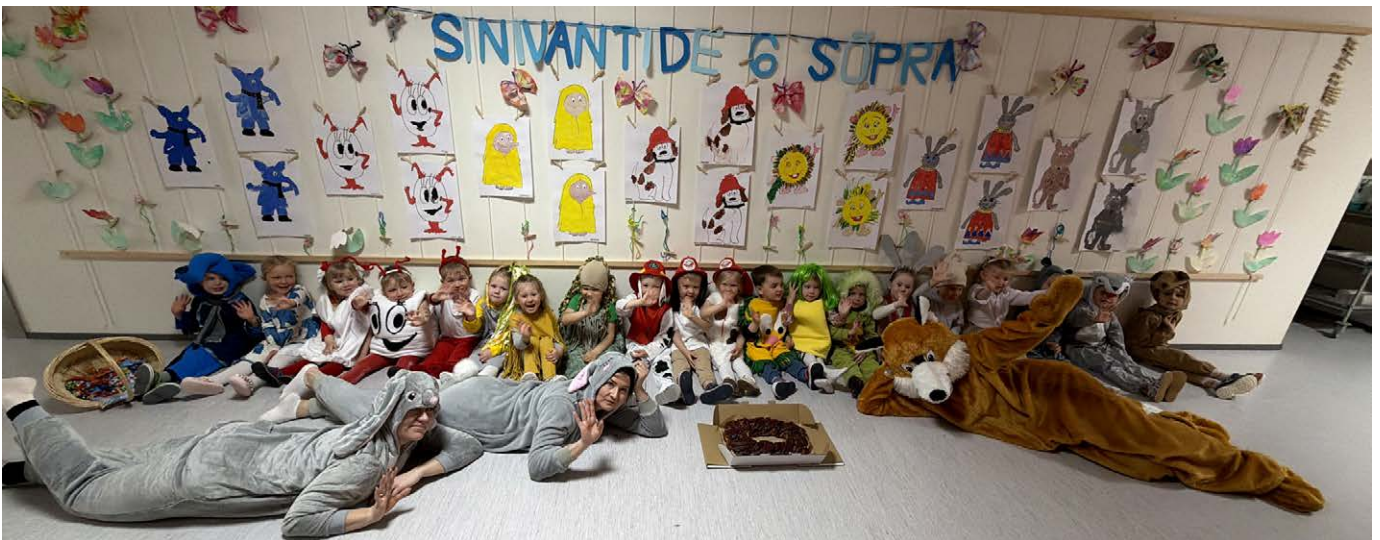
Koos on tore lustida.

Triinu Jüris, Rõõmu maja Sinivantide rühma õpetaja