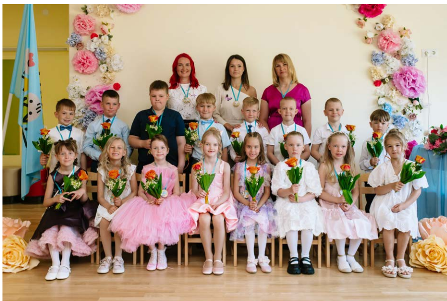
Sipsikud rühma lõpetajad.