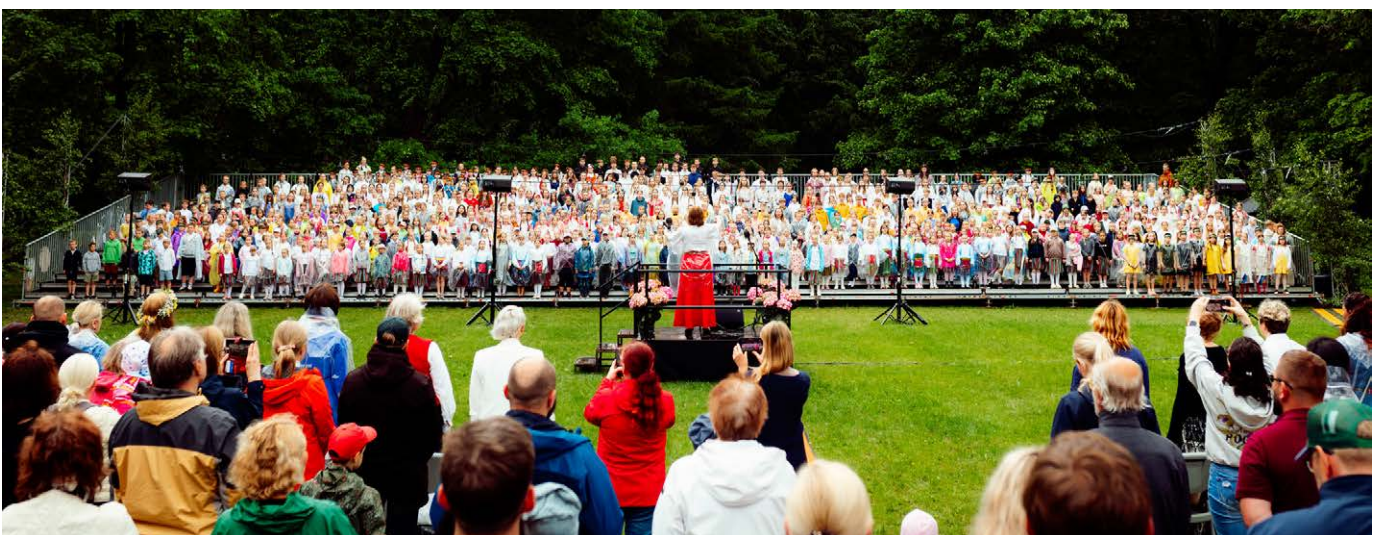
Luunja lastelaulupeol jagasid laulurõõmu üle 1100 lapse.