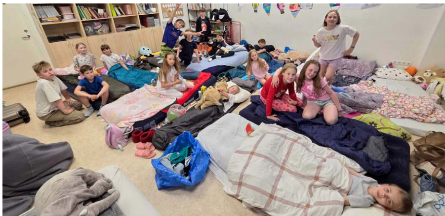
3.b klassi öölugejad.

Kaie Kink Luunja keskkooli õppejuht ja 4.c klassijuhataja