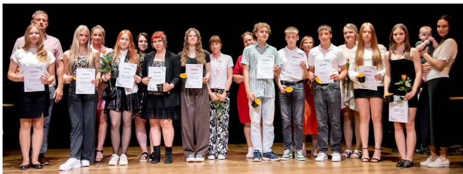
Tunnustatud 7. klasside õpilased