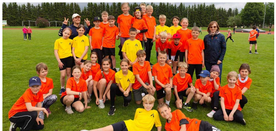
Meie tubli võistkond.