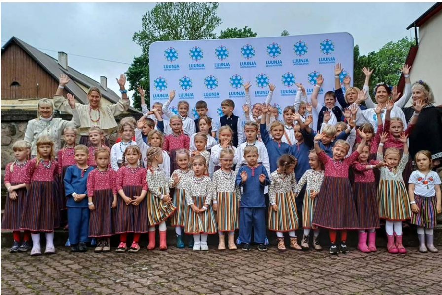
Midrimaa mudilaskoor Luunja lastelaulupeol.

Talvel leidis meie magnetiline seinakaart-mäng Luunjast kaasaegse lahenduse – õpetajate koostöös valmis Luunja e-kaart, kuhu on koondatud valla olulisemad loodusobjektid, ajaloolised paigad ja märgilised hooned, et toetada laste teadmisi oma koduvallast ning tugevdada sidet kohaliku kultuuri- ja looduspärandiga. Rühmad külastasid