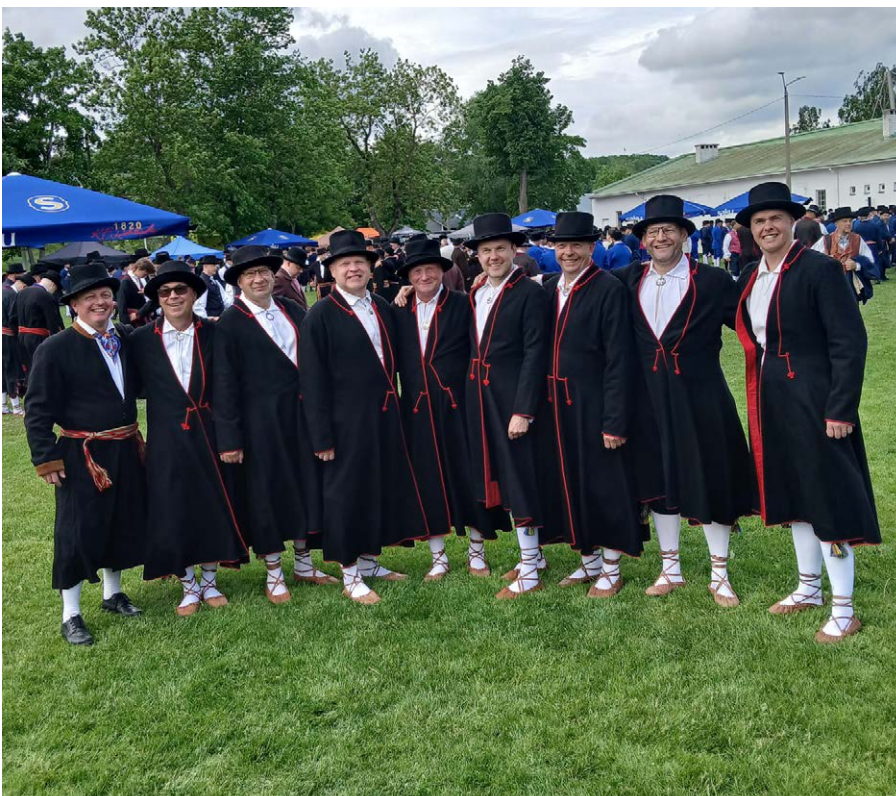
Trambali viiekordsed mehed hetkel enne peaproovi.

Kõige rohkem meeldis mulle ettevalmistusperioodi juures see, et kaheks tunniks kadusid töö- ja argimõtted täielikult. Keskenduda tuli ainult sammudele, liikumistele ja sellele, et teistele jalgu ei jääks. Arvan, et olen kiire õppija ja kasutasin ka siinkohal oma tavapärasest meetodit – töökust, harjutamist ja paras koguses matemaatilist loogikat. Kui sammud enda jaoks süsteemselt lahti mõtestada, muutub kõik märksa lihtsamaks. Vähemalt minu puhul selline