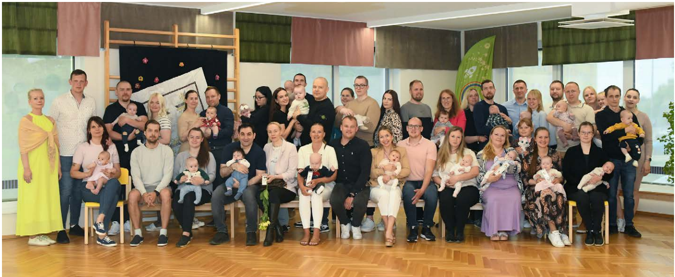
Luunja valla kõige nooremad ilmakodanikud traditsioonilisel lusikapeol.