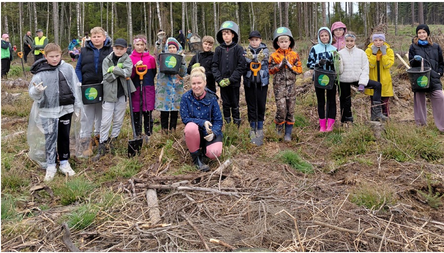
Särasilmsed metsaistutajad.

sul taastatud olema – tavaliselt kuni viie aasta jooksul peab kasvama uus metsapõlv. Selle nimel tehakse palju tööd juba ammu enne istutamist. Näiteks kuuse-istikute kasvatamine algab taimlates mitu aastat varem. Väikesed seemned külvatatakse spetsiaalsetesse kasvatuskastidesse ning kuuseistik kasvab 2 + 2 aastat, enne kui ta on piisavalt tugev metsa istutamiseks.