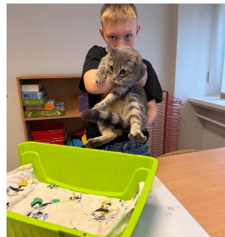
Lemmikloom 2.c klassis.