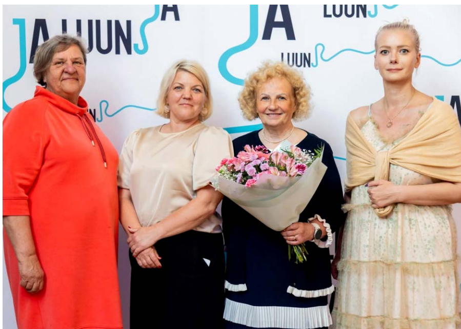
10. juunil tänasid Tartumaa vallavalitsused koos Tartumaa omavalitsuste liiduga Luunja kultuuri- ja vabaajakeskuses oma koduhooldustöötajaid. Juba traditsiooniks kujunenud tänuüritus toimus tänavu kuuendat korda ning võõrustaja oli Luunja vald.