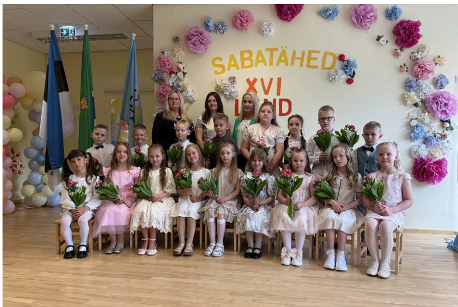
Sabatähed rühma lõpetajad.