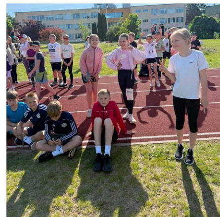
Rõõmsad spordipäevalised.