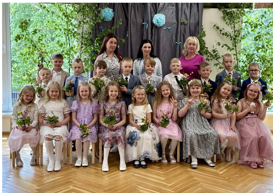
Midrimõmmide rühma lõpetajad