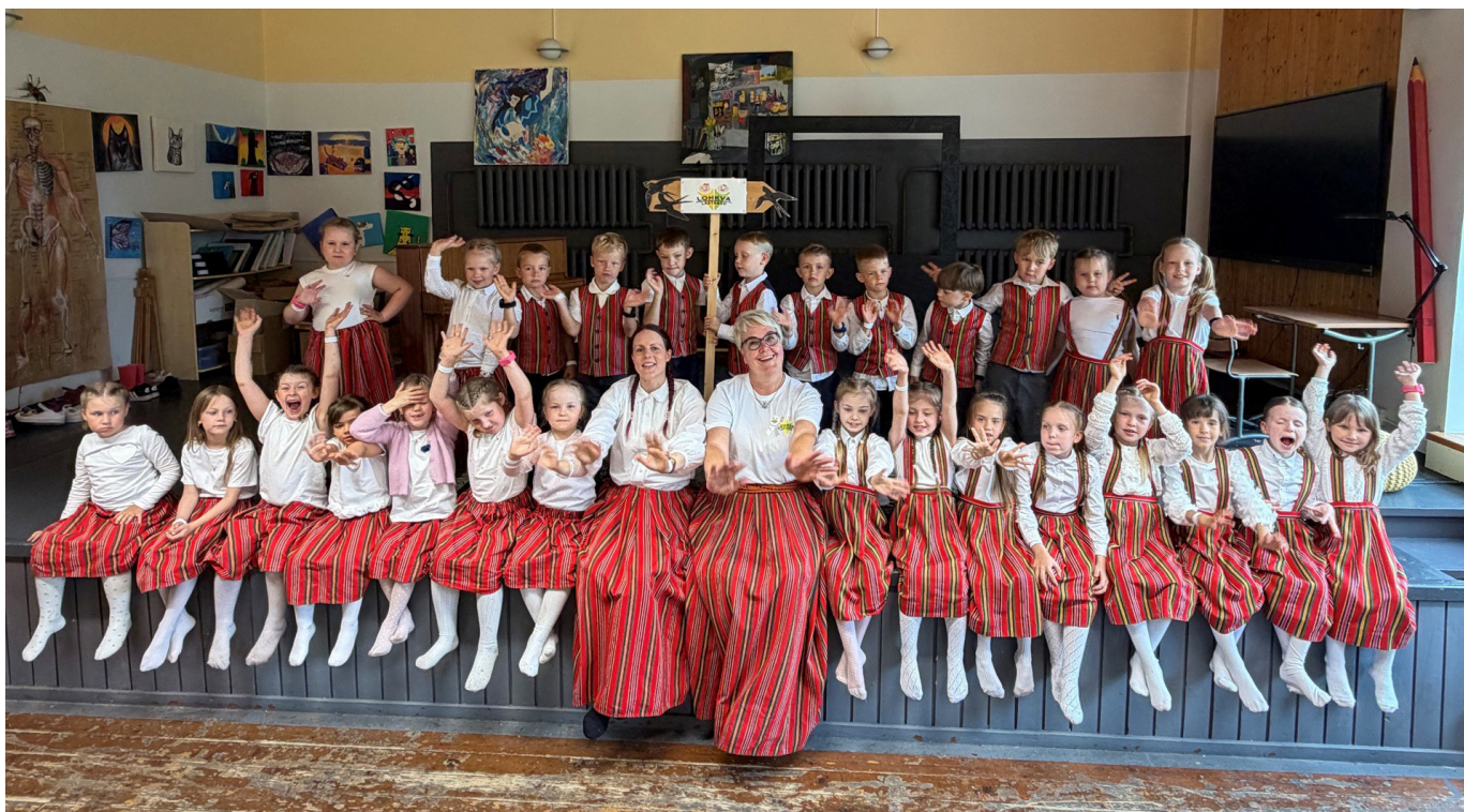
Lohkva lasteaias laulupeo esindus.