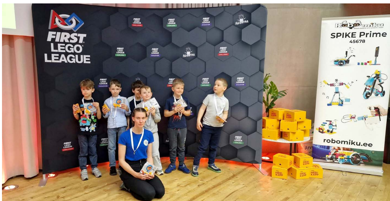
Luunja lasteaia Midrimaa grupp koos Anne noortekeskuse grupiga.