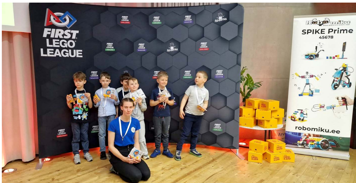
Luunja lasteaia Midrimaa grupp koos Anne noortekeskuse grupiga.