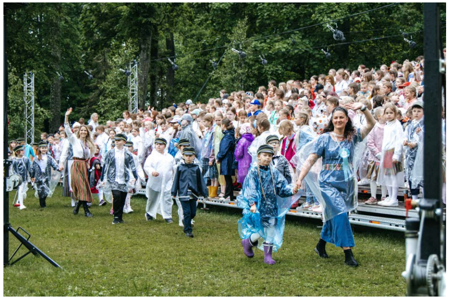
Laulupeole eelnes kooride ja koorijuhide rongkäik läbi Luunja.