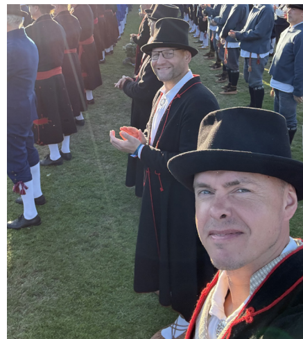
Kolmanda kontserdi finaalis.

Kui keegi oleks mulle aasta tagasi öelnud, et seisan koos tuhandete meestega Rakvere staadionil ja tantsin meeste tantsupeol, oleksin seda üsna ebatõenäoliseks pidanud. Täna meenutan möödunud tänutundega. Küll on tore, et leidub järjekindlaid inimesi, kes esimesest „ei“-st ennast mõjutada ei lase. Ja suurepärane, et leidub inimesi, kes teevad oma tööd pühendumuse ja missioonitundega, tulevad oma vabast ajast ja perede kõrvalt kokku, et traditsioone ja kultuuri edasi kanda.