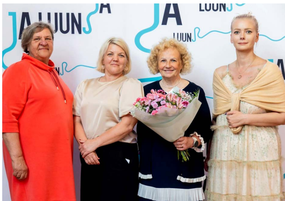
10. juunil tänasid Tartumaa vallavalitsused koos Tartumaa omavalitsuste liiduga Luunja kultuuri- ja vabaajakeskuses oma koduhooldustöötajaid. Juba traditsiooniks kujunenud tänuüritus toimus tänavu kuuendat korda ning võõrustaja oli Luunja vald.