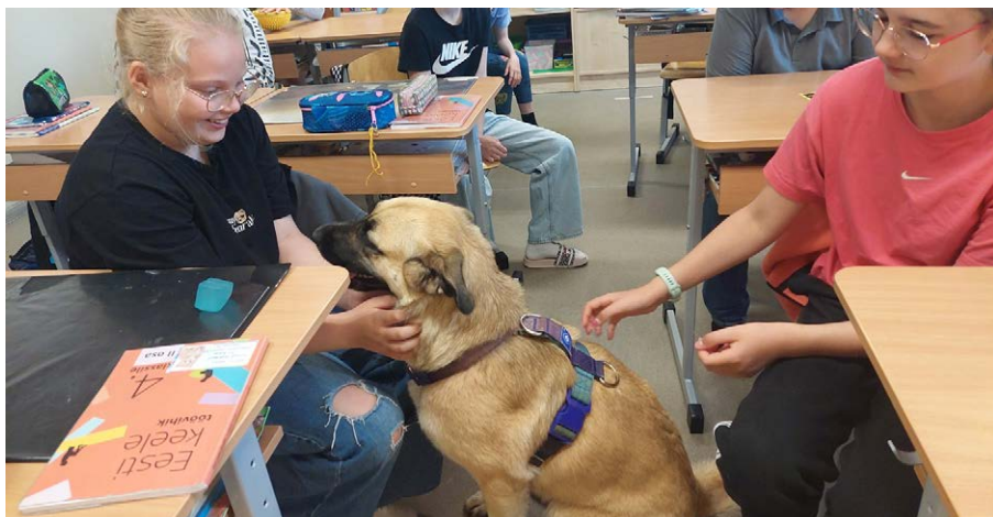
Koer Murakas lastega tutvumas.