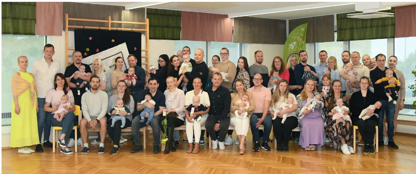
Luunja valla kõige nooremad ilmakodanikud traditsioonilisel lusikapeol.