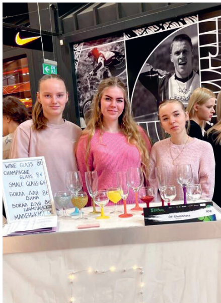
Õpilasfirma GlamGlas Riias Domina ostukeskuses.

Õpilaste osalemist Kaunase rahvusvahelisel festivalil toetas Jõgeva, Tartu, Põlva, Viljandi, Valga ja Võru maakonna koostööst sündinud projekt „Lõuna-Eesti ettevõtlikud noored“ (LEEN), mille eesmärgiks on tõsta regiooniuüleselt noorte ettevõtlikkust.