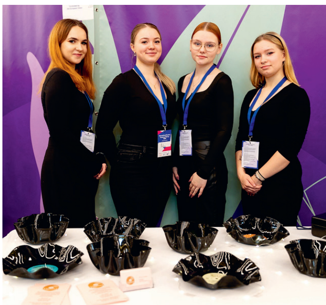
Õpilasfirma VinBowl rahvusvahelisel õpilasfirmade MeetUpil Tartus.