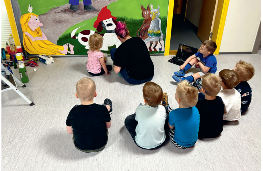
Krõllid näpunäiteid ootamas

Töö lõpetati ja viimistleti pühapäeva, 10. märtsi pärastlõunal ning esmaspäeval said kõik suured ja väikesed rõõmukad seda imelist loomingut vaatamas ja katsumas käia. Meie lasteaia Facebooki lehel on kogu protsessist video ülevaade ja ka kunstniku kontaktid, kui su kontori/kodusein vajab teistmoodi lahendust.