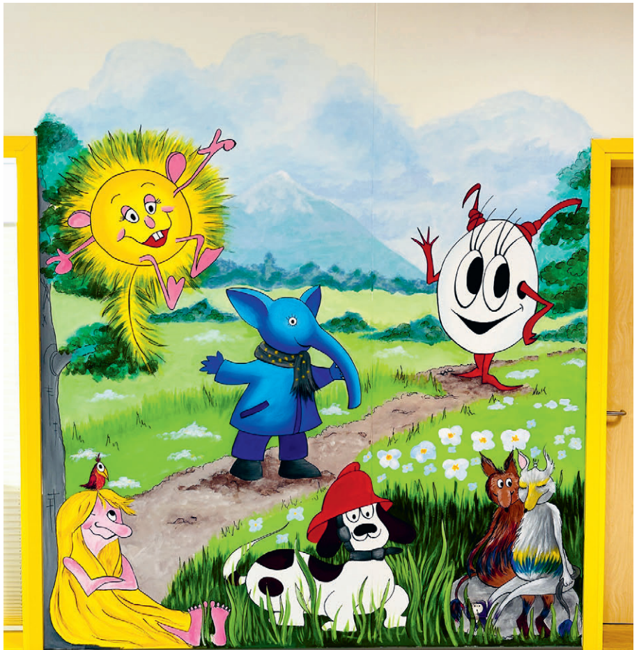
Meie Rõõmu maja tegelased.

Veel kord suur aitäh, kunstnik Geiu Hummal ja heategija Geidi Rõõm! Oleme kogu lasteaia südamest tänulikud selle imelise kingituse eest!