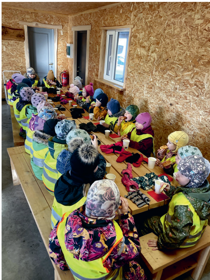
Teed ja saiakesi nautimas.