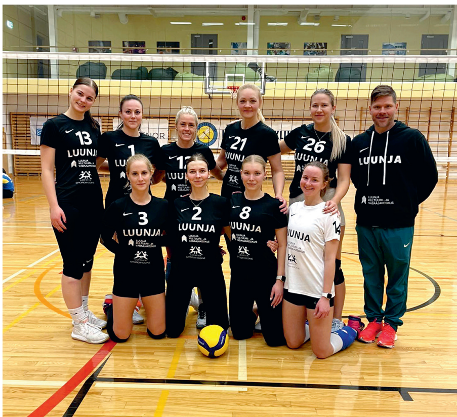
Luunja naiskond Eestimaa rahvaliiga finaaltturniiril Lähtel.

Kaido Linde Luunja kultuuri- ja vabaajakeskuse sporditöö spetsialist