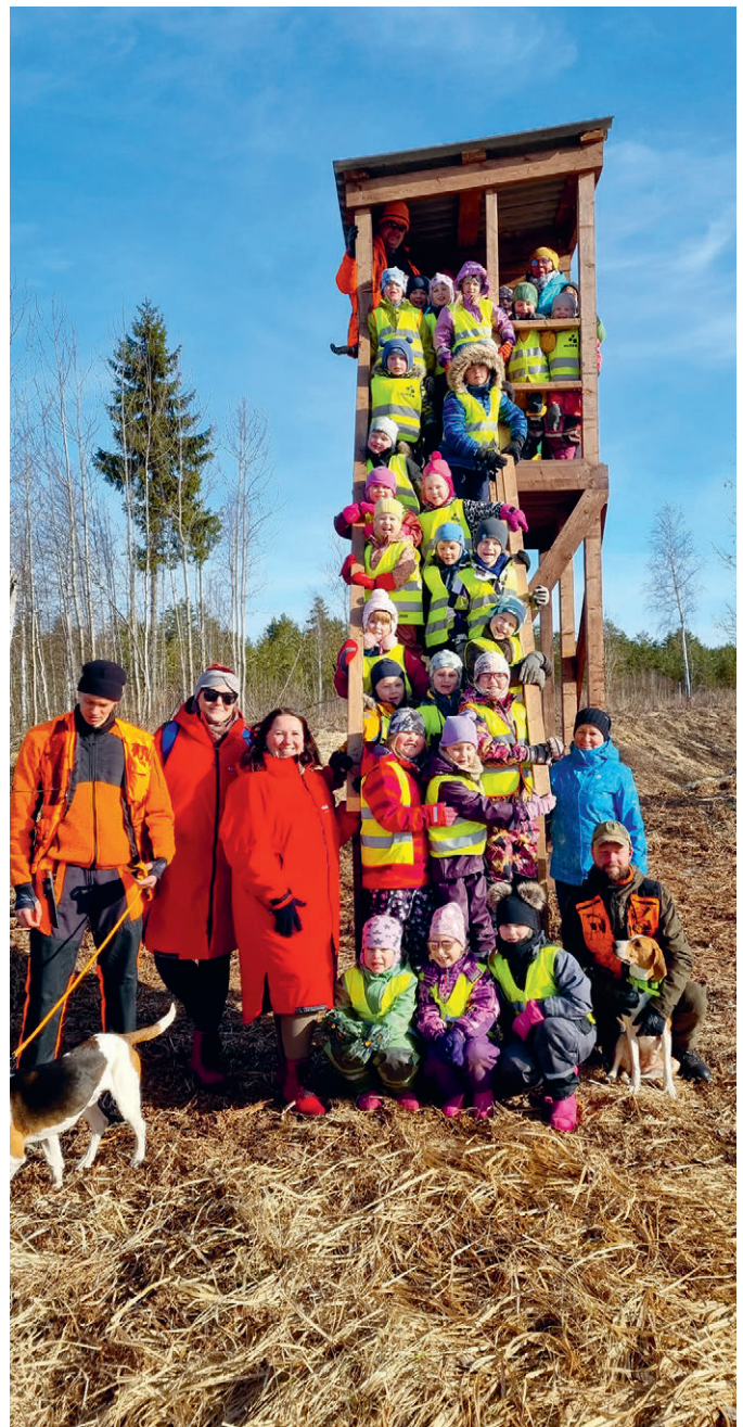
Luunja lasteaed Midrimaa koos Luunja jahiseltsi esindajatega metsaretkel.