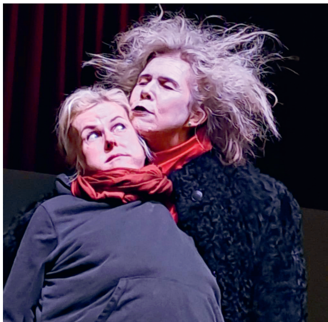
Koera Kaarel ja Vanatühi. Kas Koera Kaaril õnnestub Vanatühi ja petta või mitte?