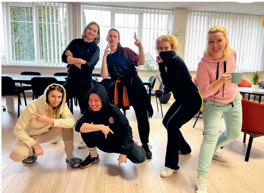
Stiilinädal – õpsid dressides.

Kultuurinädalale järgnes kohe sportlik nädal – algas klassidevaheline koroo-