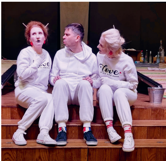
Kubjas Hans tegi omale kratid lumest, aga mis saab siis, kui tuleb kevad?