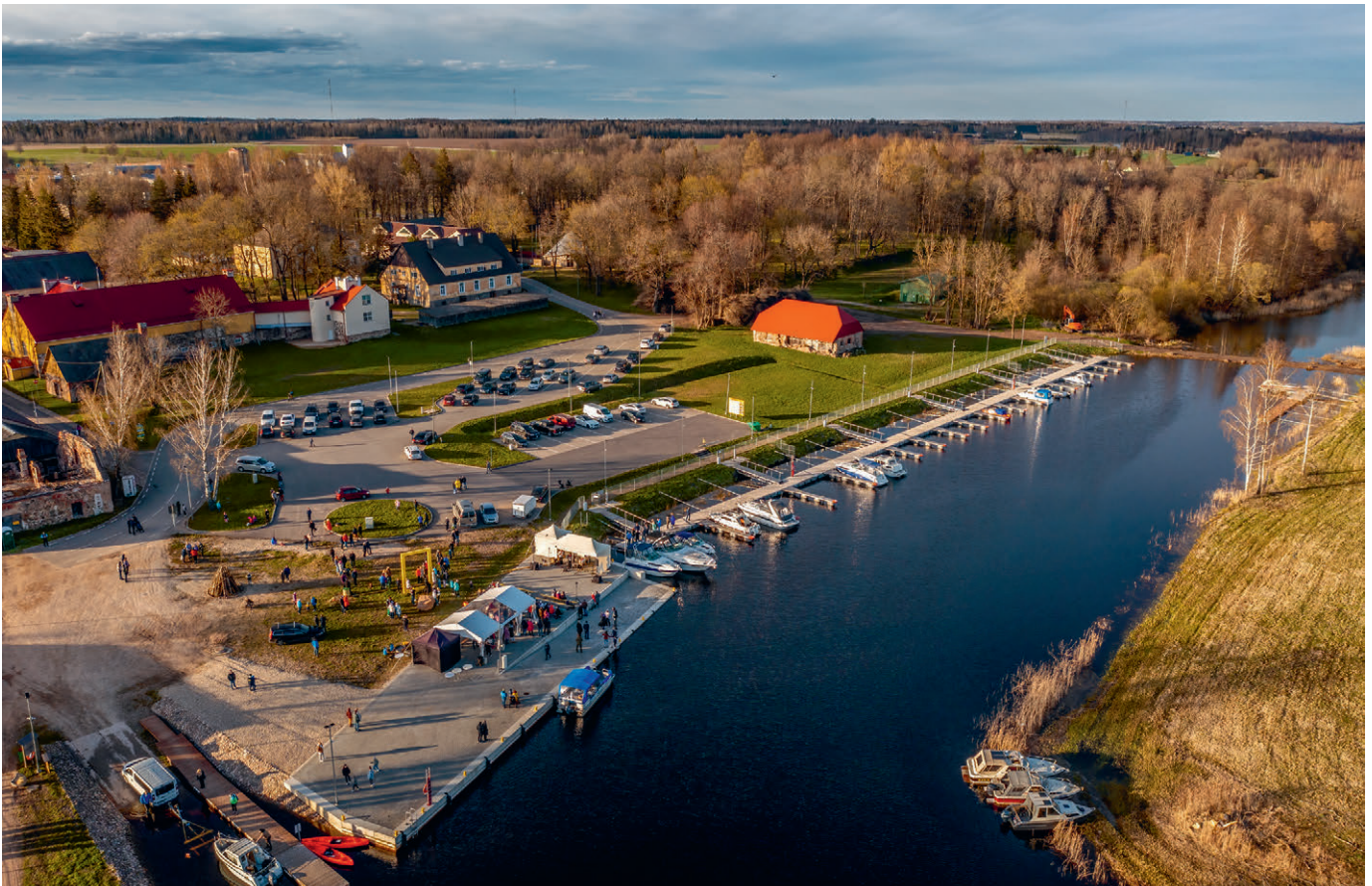
Projektitoetuste kaasabil saame elavdada tegevusi nii veel kui maal.